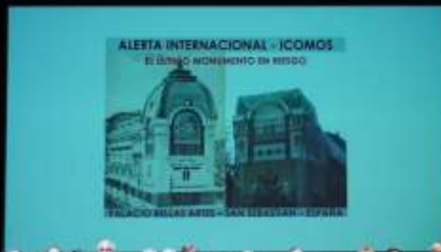
Simposio Internacional Safety in Heritage