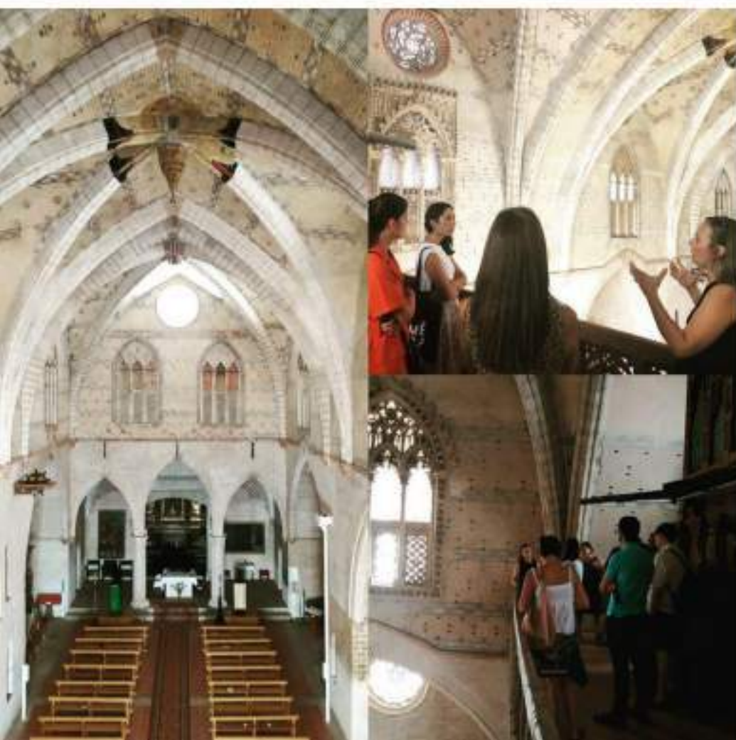
Visita de la Junta Directiva a diferentes enclaves mudéjares en Aragón