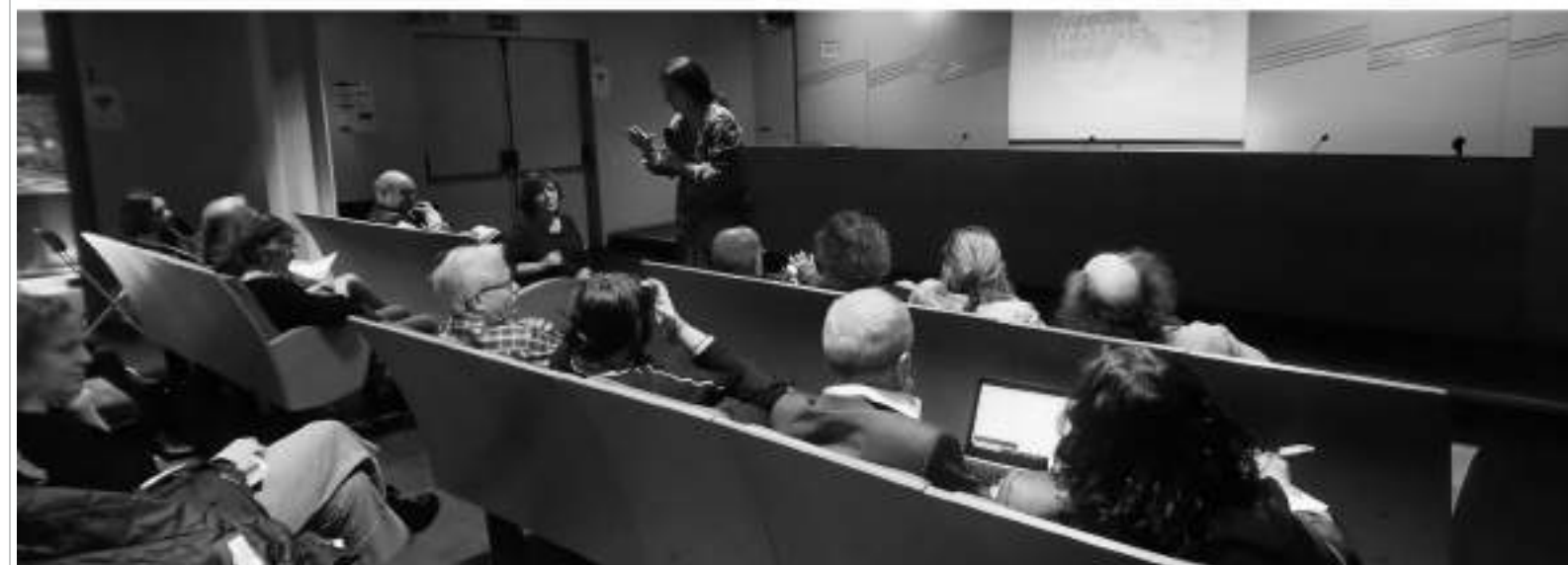
Comunicación de la representante española en el EPGM durante la AGA 2019