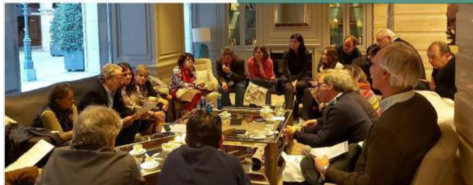
Reunión con entidades patrimoniales en Granada