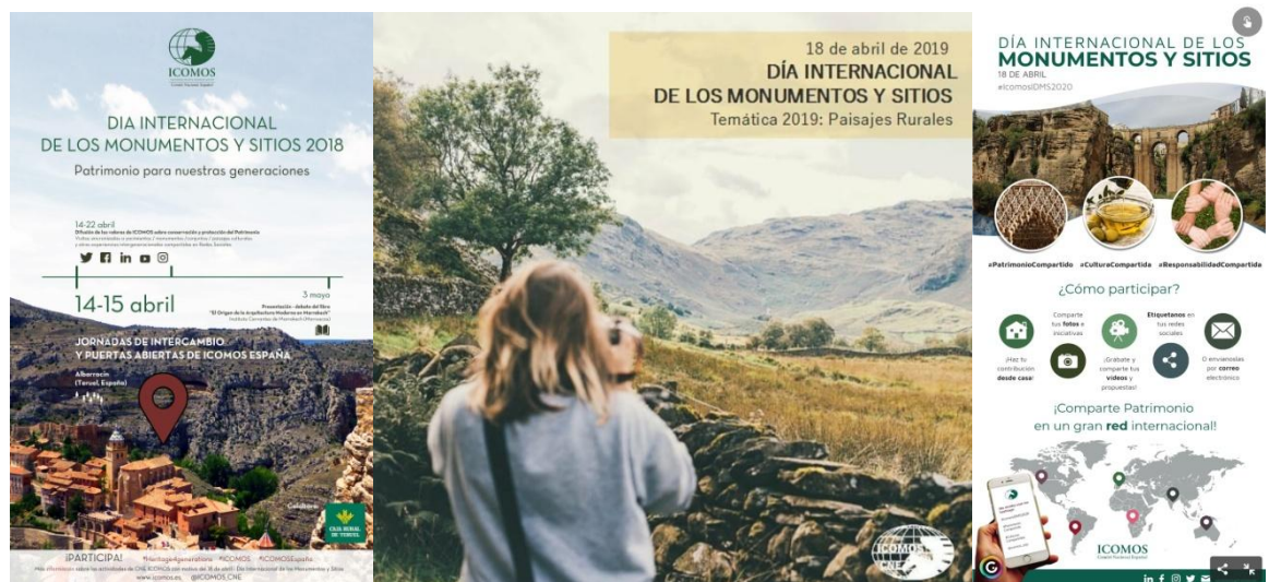
Carteles divulgativos del DIMS de las últimas 3 ediciones

En respuesta a la llamada global para una mayor inclusión y reconocimiento de la diversidad, el Día Internacional de los Monumentos y Sitios 2021 invita a los participantes a reflexionar, reinterpretar y reexaminar las narrativas existentes (ver Anexo I).